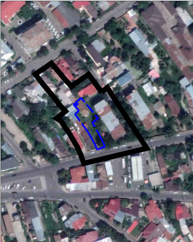
INCADRARE IN ZONA 1:2000